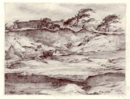
Kiesgrube bei Sahlenburg (Duhnen) Kaltnadel (29,5 x 23 cm), 1930