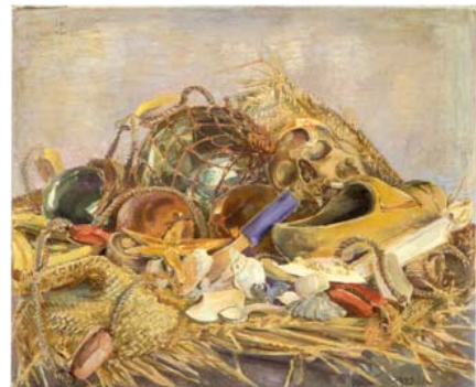
Strandgut Öl auf Leinwand (80 x 68 cm), 1938